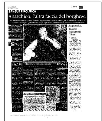
Ritaglio stampa ad uso esclusivo del destinatario, non riproducibile.